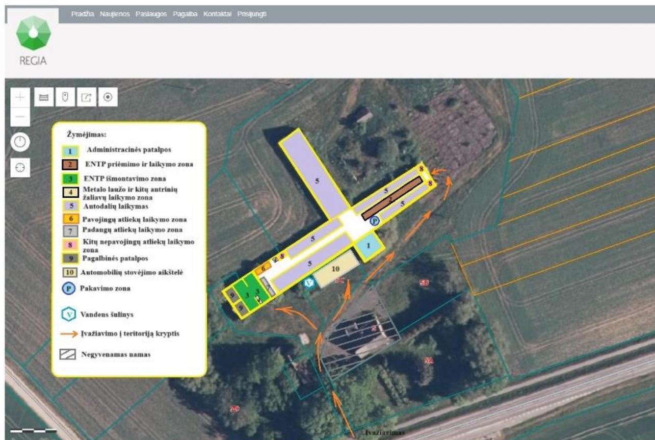
1 pav. Funkcinių zonų planas 1

Numatomi naudoti irenginiai ir įranga -tralis (1 vnt.) ENTP transportavimui į veiklavietę; automobiliniai keltuvai (2 vnt.) ENTP išmontavimo procese, hidraulinis rankinis keltuvas (1 vnt.) atliekų bei autodalių ir mazgų pervežimui į laikymo vietas, elektroninės svarstyklės (1 vnt.), elektriniai kampiniai šlifuočiai, veržliarakčiai ir kiti mechaniniai įrankiai.