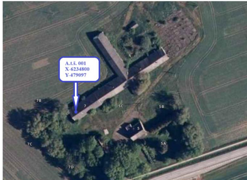
3 pav. PŪV oro taršos šaltinių išsidėstymo schema

ŠESD nebus išmetamos į aplinkos orą, freonai iš transporto priemonių pagal sutartį bus iš ENTP pašalinami kitos įmonės. Aplinkos oro taršos šaltinių išsidėstymo schema ir koordinatės LKS koordinatių sistemoje pateikiama žemiau 3 pav.