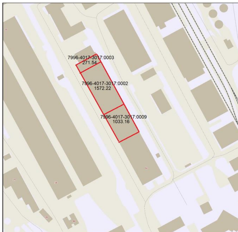
2 pav. UAB „Sentauras“ teritorija

2 paveiksle pavaizduota UAB „Sentauras“ teritorija pagal nekilnojamojo turto mokesstinės vertės išrašų registro numerius.