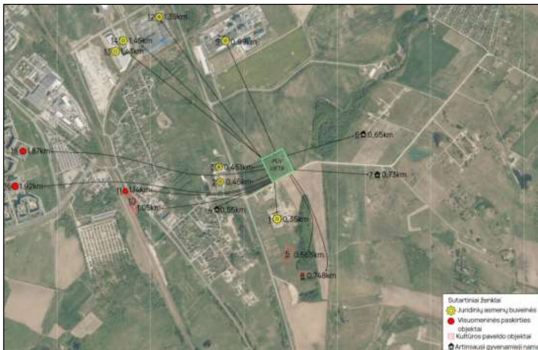
4 pav. PŪV teritorijos gretimybės ( https://regia.lt/map/regia2 )

saugoma teritorija nuo PŪV teritorijos apie 4,303 km atstumu pietryčių kryptimi yra nutolęs Kalvių atkuriamasis sklypas, kuris taip pat patenka į Europos saugomų teritorijų tinklo Natura „2000“ paukščių apsaugai svarbias teritorijas (LTKLAB003).