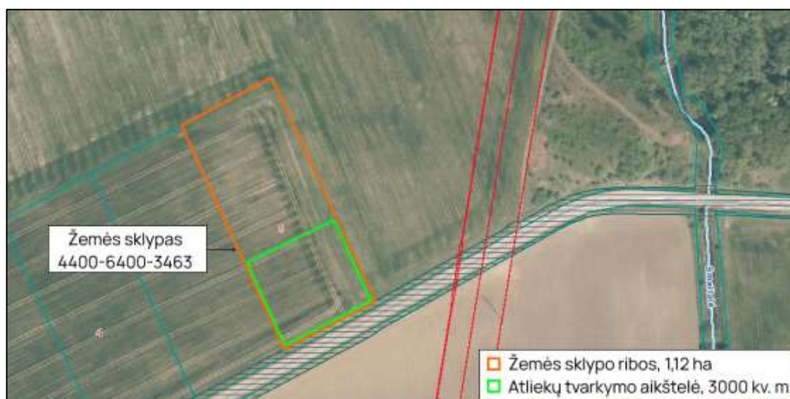
1 pav. Įrenginio išsidėstymas teritorijoje

Ūkinė veikla bus vykdoma žemės sklype, adresu Mažosios Lietuvos g. 8, Rimkų k., Dovilų sen., Klaipėdos r. sav., kurio unikalus numeris – 4400-6400-3463, naudojimo paskirtis – kita, naudojimo būdas – pramonės ir sandėliavimo objektų teritorijos, plotas – 1,12 ha. Žemės sklype specialiųjų žemės naudojimo sąlygų nėra. Žemės sklypo nuosavybės teisė priklauso veiklos vykdytojui. Nėkilnojamojo turto duomenų bazės išrašas pateiktas 4 priede.