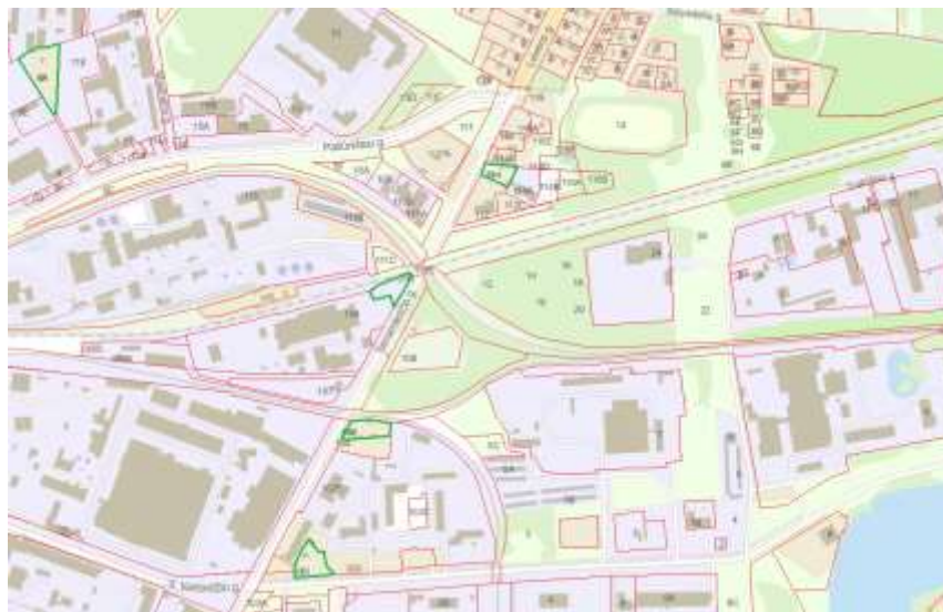
1 pav. Artimiausia gyvenamoji teritorija

Pagal 2023 metų Panevėžio miesto teritorijos bendrąjį planą, planuojamos ūkinės veiklos sklypas priskiriamas prie urbanizuotų ir numatomų urbanizuoti teritorijų, zona – inžinerinės infrastruktūros. Aplink planuojamos ūkinės veiklos sklypą vyrauja urbanizuotos ir numatomos urbanizuoti teritorijos, zonos – inžinerinės infrastruktūros ir pramonės ir sandėliavimo zonos.