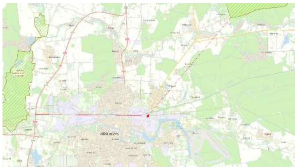
5 pav. Artimiausios saugomos teritorijos (šaltinis: Saugomų teritorijų valstybės kadastras )

Artimiausios saugomos teritorijos – Sanžilės kraštovaizdžio draustinis (identifikavimo kodas – 0230100000208), nutolęs apie 7,5 km. atstumu vakarų kryptimi, Žaliosios girios botaninis-zoologinis draustinis (identifikavimo kodas – 0210700000014), nutolę apie 8,0 km. atstumu šiaurės rytų kryptimi.