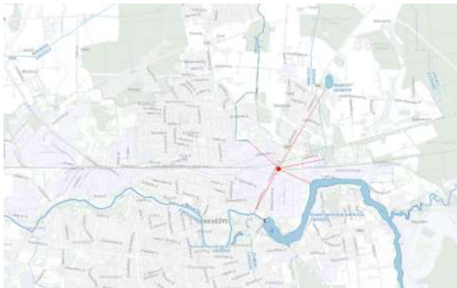
6 pav. Lietuvos upių, ežerų ir tvenkinių kadastras

Vadovaujantis Lietuvos upių, ežerų ir tvenkinių kadastru, artimiausi vandens telkiniai – Ekranų gamybos tvenkinys (13050001), nutolęs apie 740 m. atstumu pietryčių kryptimi, upė L-1 (41010985), nutolusi apie 920 m. atstumu šiaurės vakarų kryptimi, upė Vilkutė (41010984), nutolusi apie 1,0 km. atstumu rytų kryptimi, upė Nevėžis (13010001), nutolusi apie 1,1 km. atstumu pietvakarių kryptimi, ežeras Paežeris (41030070), nutolęs apie 2,1 km. šiaurės rytų kryptimi.