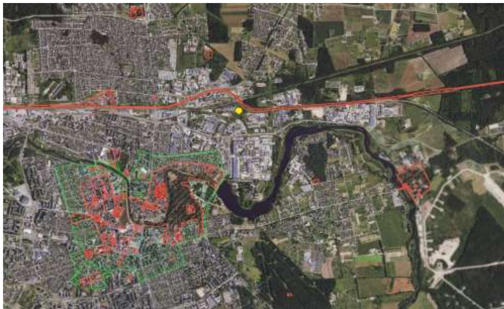
3 pav. Artimiausios nekilnojamosios kultūros paveldo vertybės

Remiantis Lietuvos Respublikos Kultūros paveldo departamento kultūros paveldo vertybių registro žemėlapiu, artimiausios kultūros paveldo vertybės – Siaurojo geležinkelio kompleksas (kodas 21898), nutolęs apie 45 m. atstumu šiaurės kryptimi, Panevėžio miesto istorinė dalis (kodas 31872), nutolusi apie 940 m. atstumu pietvakarių kryptimi, Poeto Mato Grigonio namas (kodas 16635) nutolęs apie 830 m. atstumu šiaurės vakarų kryptimi, Lietuvos partizanų užkasimo vieta ir kapai (kodas 44925), nutolę apie 1,5 km. atstumu pietryčių kryptimi, Pajuosčio dvaro sodyba (kodas 4401), nutolusi apie 2,6 km. atstumu pietryčių kryptimi.