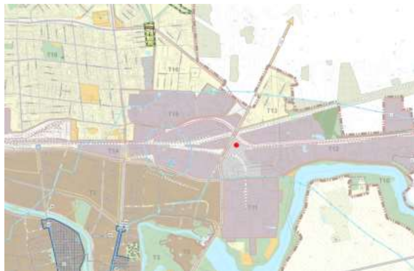
2 pav. Ištrauka iš 2023 m. Panevėžio miesto bendrojo plano

Pagal 2023 metų Panevėžio miesto teritorijos bendrąjį planą, planuojamos ūkinės veiklos sklypas priskiriamas prie urbanizuotų ir numatomų urbanizuoti teritorijų, zona – inžinerinės infrastruktūros. Aplink planuojamos ūkinės veiklos sklypą vyrauja urbanizuotos ir numatomos urbanizuoti teritorijos, zonos – inžinerinės infrastruktūros ir pramonės ir sandėliavimo zonos.