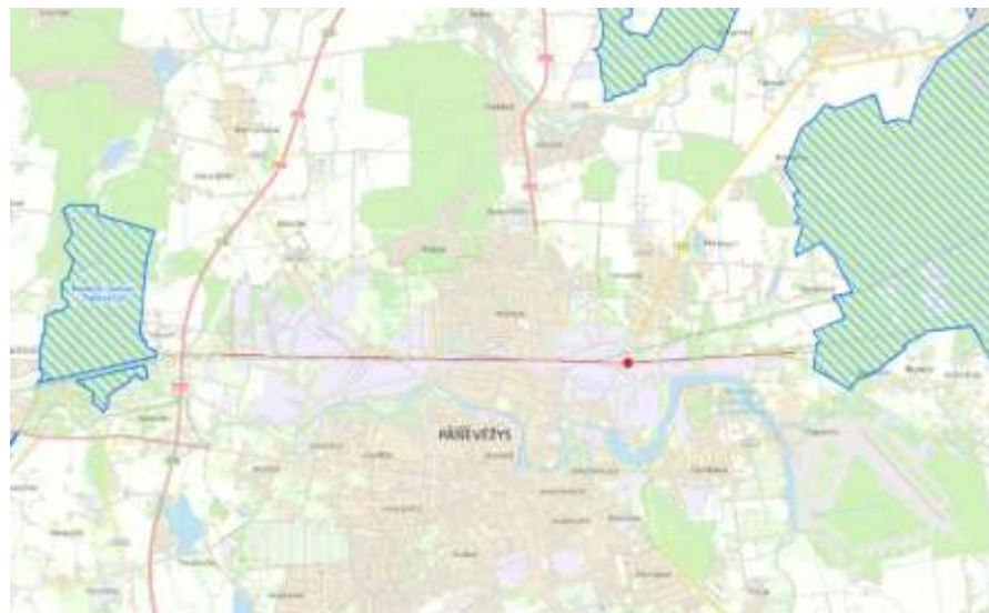
4 pav. Artimiausios NATURA 2000 teritorijos (šaltinis: Saugomų teritorijų valstybės kadastras )

Artimiausios saugomos teritorijos – Sanžilės kraštovaizdžio draustinis (identifikavimo kodas – 0230100000208), nutolęs apie 7,5 km. atstumu vakarų kryptimi, Žaliosios girios botaninis-zoologinis draustinis (identifikavimo kodas – 0210700000014), nutolę apie 8,0 km. atstumu šiaurės rytų kryptimi.