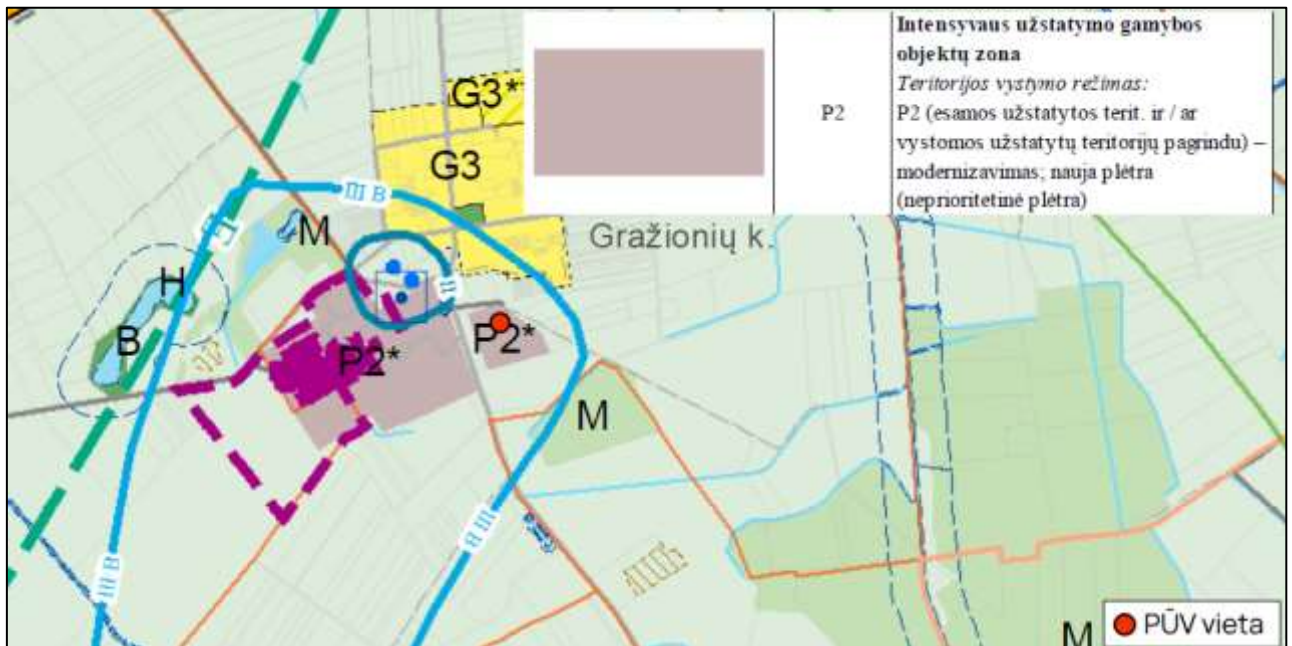
3 pav. Tauragės raj. sav. teritorijos bendrojo plano pagrindinio brėžinio fragmentas

Vadovaujantis Tauragės raj. sav. teritorijos bendrojo plano keitimo sprendinių pagrindiniu brėžiniu, nagrinėjama teritorija patenka į intensyvaus užstatymo gamybos objektų zoną, todėl vertinama, kad PŪV atitinka Tauragės raj. sav. bendrojo plano sprendinius.