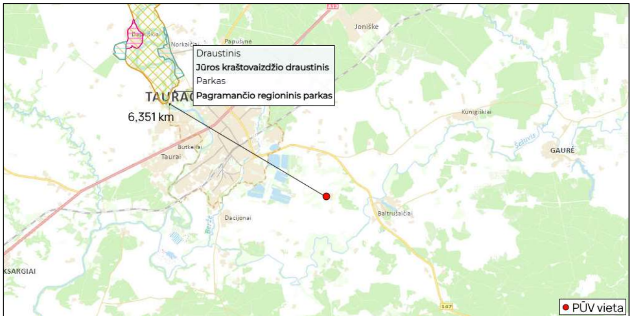
4 pav. Saugomų teritorijų valstybės kadastro žemėlapio fragmentas ( https://stvk.lt/map )

Vadovaujantis Kultūros vertybių registro žemėlapiu, nagrinėjama teritorija nesiriboja, nepatenka ir yra pakankamai nutolus nuo saugomų kultūros vertybių teritorijų, todėl vertinama, kad poveikis joms nebus daromas. Arčiausiai PŪV teritorijos esančios saugomos teritorijos: