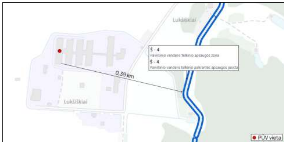
6 pav. Upių, ežerų ir tvenkinių kadastro žemėlapiu fragmentas ( https://uetk.biip.lt/zelapis/ )

Nagrinėjama teritorija nėra tankiai apgyvendinta, PŪV sklypas nesiriboja su gyvenamųjų namų sklypais. Artimiausias gyvenamasis namas yra už 479 m šiaurės rytų kryptimi nuo PŪV vietos. Vertinama, kad neigiamas poveikis nebus daromas.