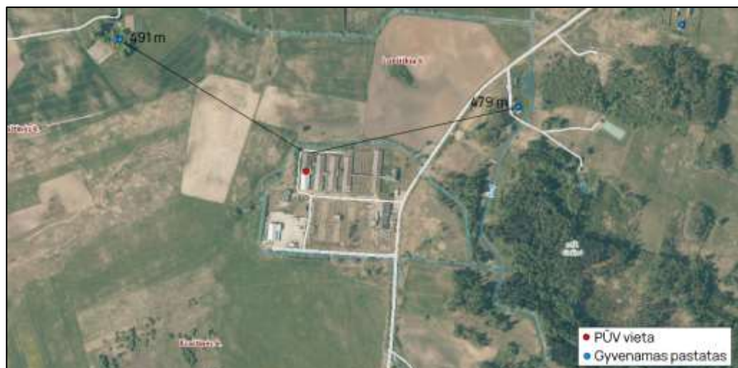
7 pav. Regia.lt žemėlapiu fragmentas ( https://regia.lt/map/regia2/ )

Nagrinėjama teritorija nėra tankiai apgyvendinta, PŪV sklypas nesiriboja su gyvenamųjų namų sklypais. Artimiausias gyvenamasis namas yra už 479 m šiaurės rytų kryptimi nuo PŪV vietos. Vertinama, kad neigiamas poveikis nebus daromas.