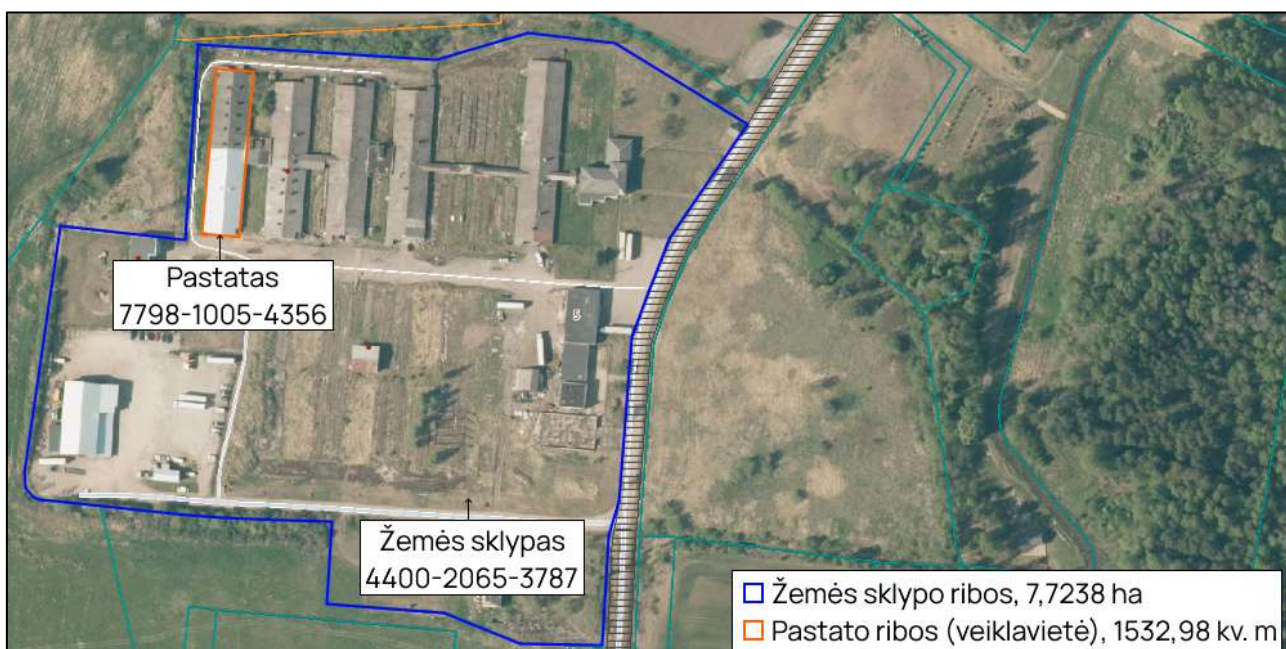
1 pav. Įrenginio išsidėstymas teritorijoje

Visa ūkinė veikla bus vykdoma pastate, kurio unikalus numeris – 7798-1005-4556, naudojimo paskirtis – gamybos, pramonės, plotas – 1532,98 kv. m. (7 priedas). Ūkinė veikla bus vykdoma 1238,94 kv. m pastato dalyje. Pastatas priklauso veiklos vykdytojui. Pastato sienos, stogas ir grindys neturi fizinių defektų, kurie galėtų turėti įtakos pastato sandarumui, pastato fizinis nusidėvėjimas neturi įtakos vykdomai veiklai.