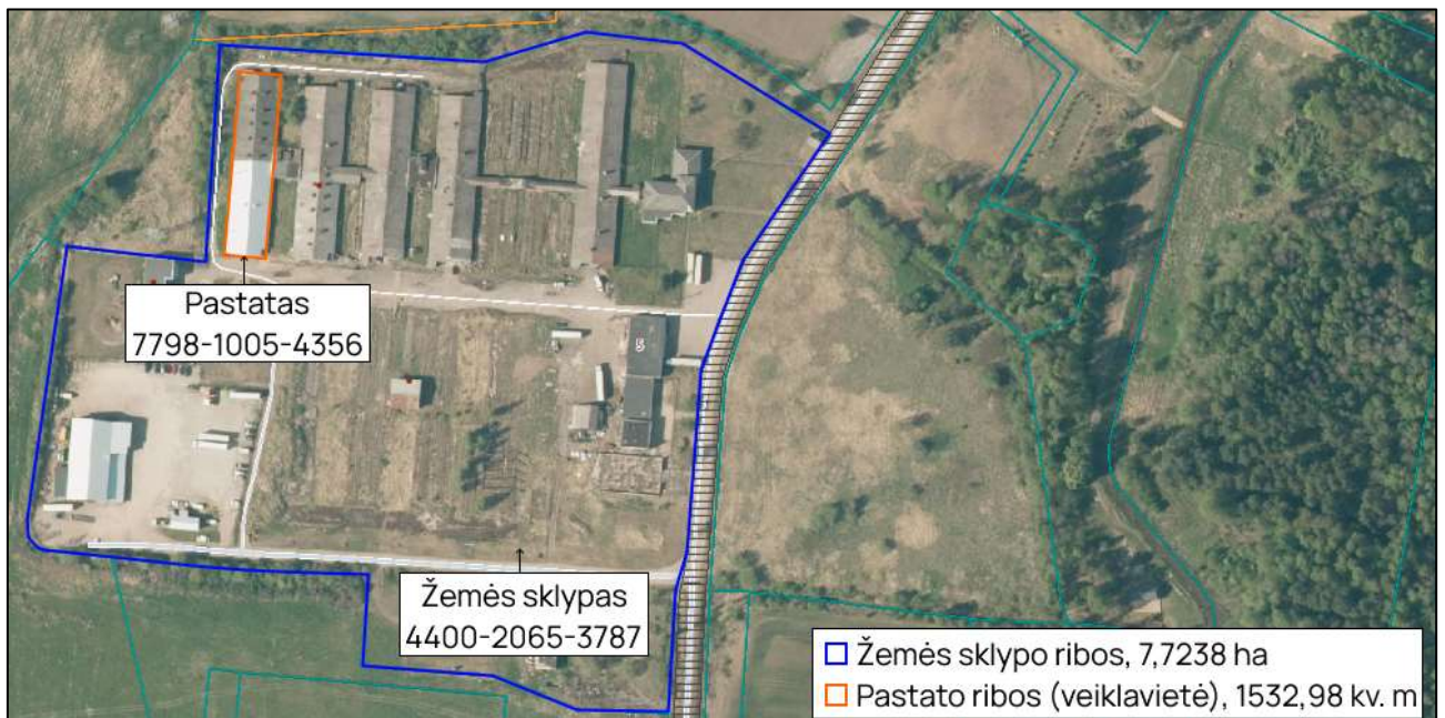
1 pav. Įrenginio išsidėstymas teritorijoje

Visa ūkinė veikla bus vykdoma pastate, kurio unikalus numeris – 7798-1005-4356, naudojimo paskirtis – gamybos, pramonės, plotas – 1532,98 kv. m. (7 priedas). Ūkinė veikla bus vykdoma 1238,94 kv. m pastato dalyje. Pastatas priklauso veiklos vykdytojui. Pastato sienos, stogas ir grindys neturi fizinių defektų, kurie galėtų turėti įtakos pastato sandarumui, pastato fizinis nusidėvėjimas neturi įtakos vykdomai veiklai.