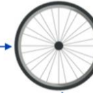
Ratas A SCIP Nr.